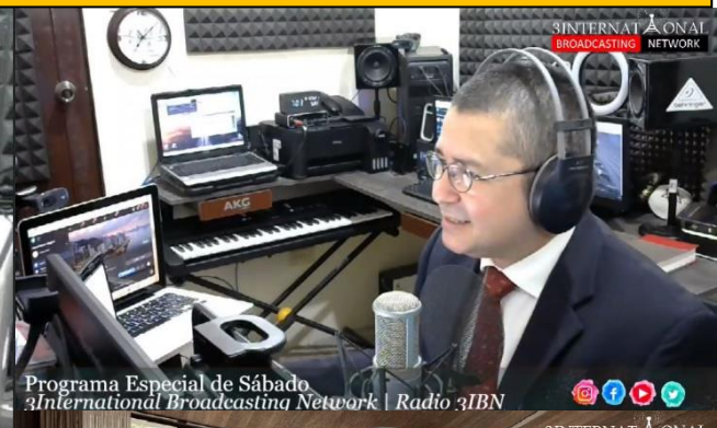
Programa Especial de Sábado 3International Broadcasting Network | Radio 3IBN