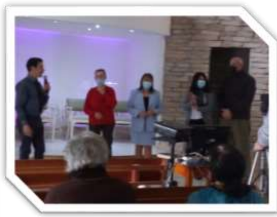
En compañía de varias personas que ese mismo día entregaron sus vidas a Cristo.