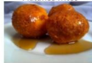
Buñuelos con miel