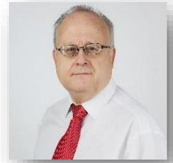
Autor: Antonio Lerma.

Las aulas siempre han tenido cuatro paredes, ahora están llenas de ventanas abiertas al mundo y el profesor no puede ser una barrera, debe suscitar el espíritu crítico en sus alumnos. El docente se debe convertir en un tutor, su finalidad debe estar en orientar al alumno en su desarrollo e impartir conocimientos en el uso de las TIC, el problema puede estar en cómo integrar el conocimiento de la lengua, las matemáticas, la historia, el razonamientos, etc. utilizando estas tecnologías, él debe permeabilizar el uso de las TIC. ¿Cómo? de la única manera que se incorpora el conocimiento, estudiándolas y no negándolas.