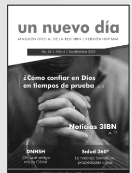
Imagen de portada Freepik

A menos que se especifique lo contrario, todas las imágenes provienen de internet.