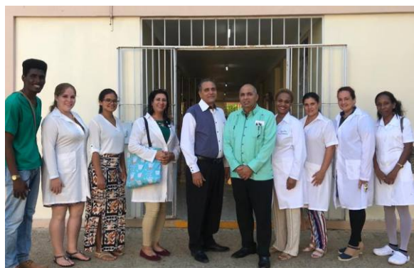
Batas Blancas "Equipadas para servir".